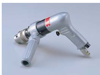
Impugnatura laterale (vedi pag. 24)